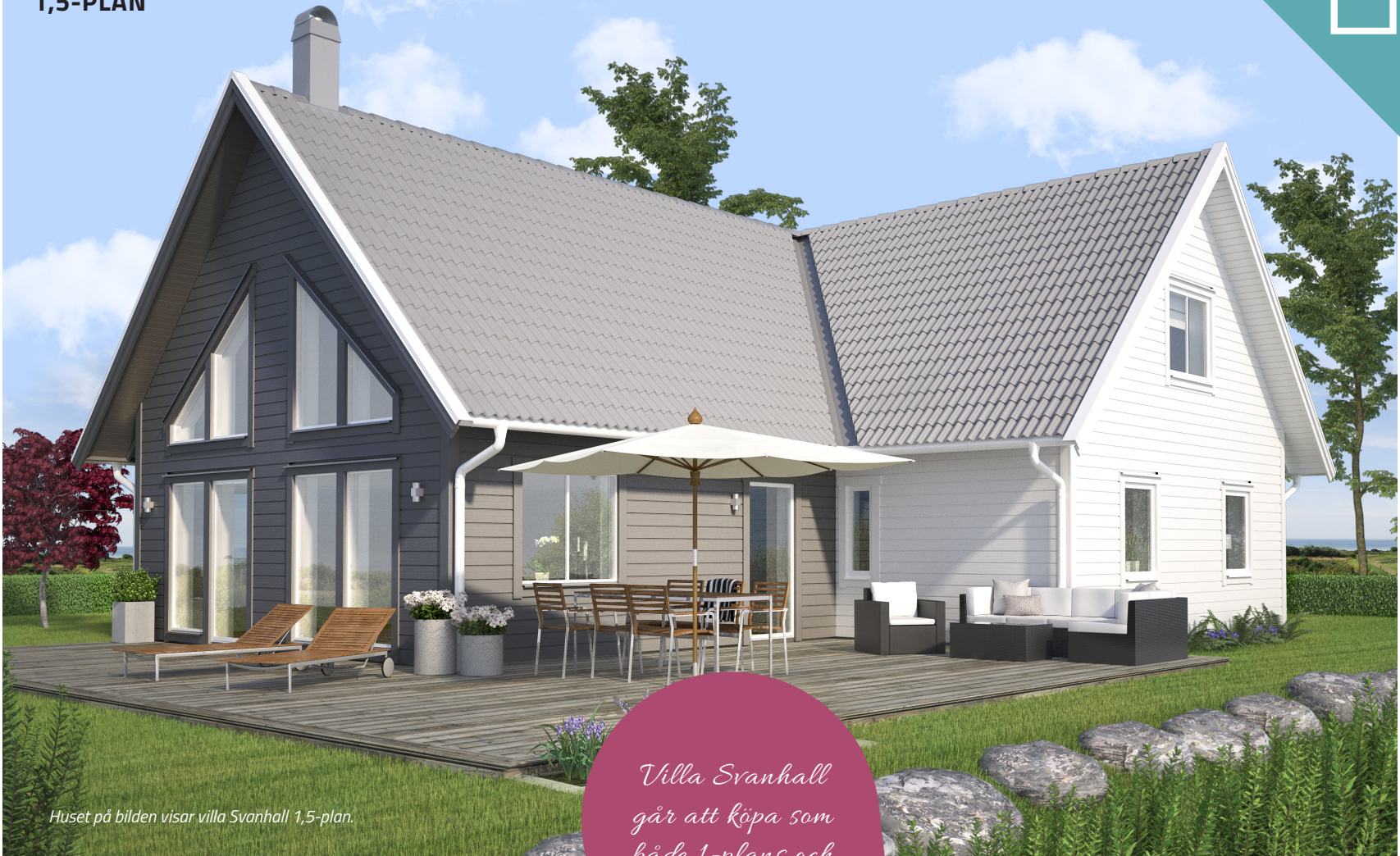
Huset på bilden visar villa Svanhall 1,5-plan.

Villa Svanhall går att köpa som både 1-plans och 1,5-planshus.