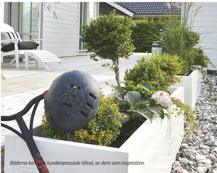
Bilderna kan vara kundanpassade tillval, se dem som inspiration.