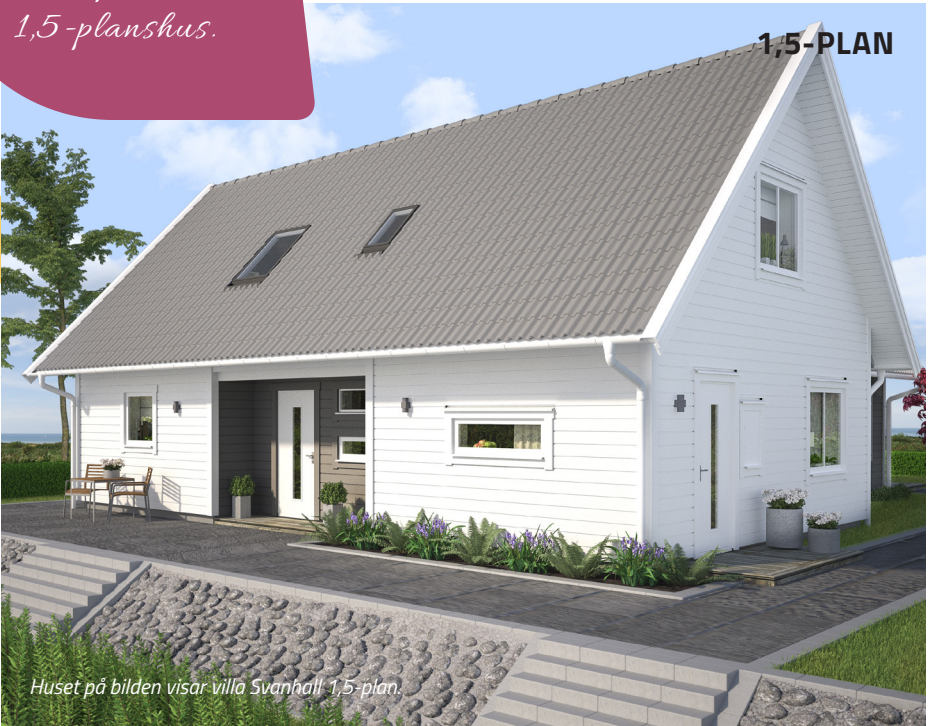
Huset på bilden visar villa Svanhall 1,5-plan.